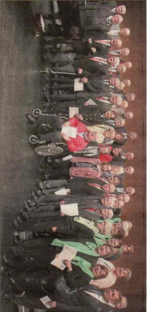
die Grippewelle sorgte dafür, dass die Reihen der Jubilare auf der Bühne etwas ausgedünnt waren – nicht alle der eigentlich 74 Männer und Frauen konnten kommen.

darduschor Lüdenscheid, ein gemischter Projektchor unter der Leitung von Maïdi Langebartels, gab, begleitet von Alfia Möllmann am Klavier, unter anderem das Lied „Schau auf die Welt“ zu Gehör. Der Lüdenscheider Männerchor (Leitung: Stefan Scheidweiler), ließ schließlich Stücke wie „Ein Lied zieht hinaus in die Welt“ erklingen. ■ bot